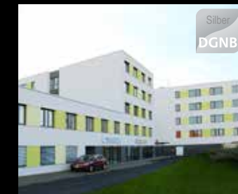
Rehaklinik mit Facharztzentrum, Großenhain