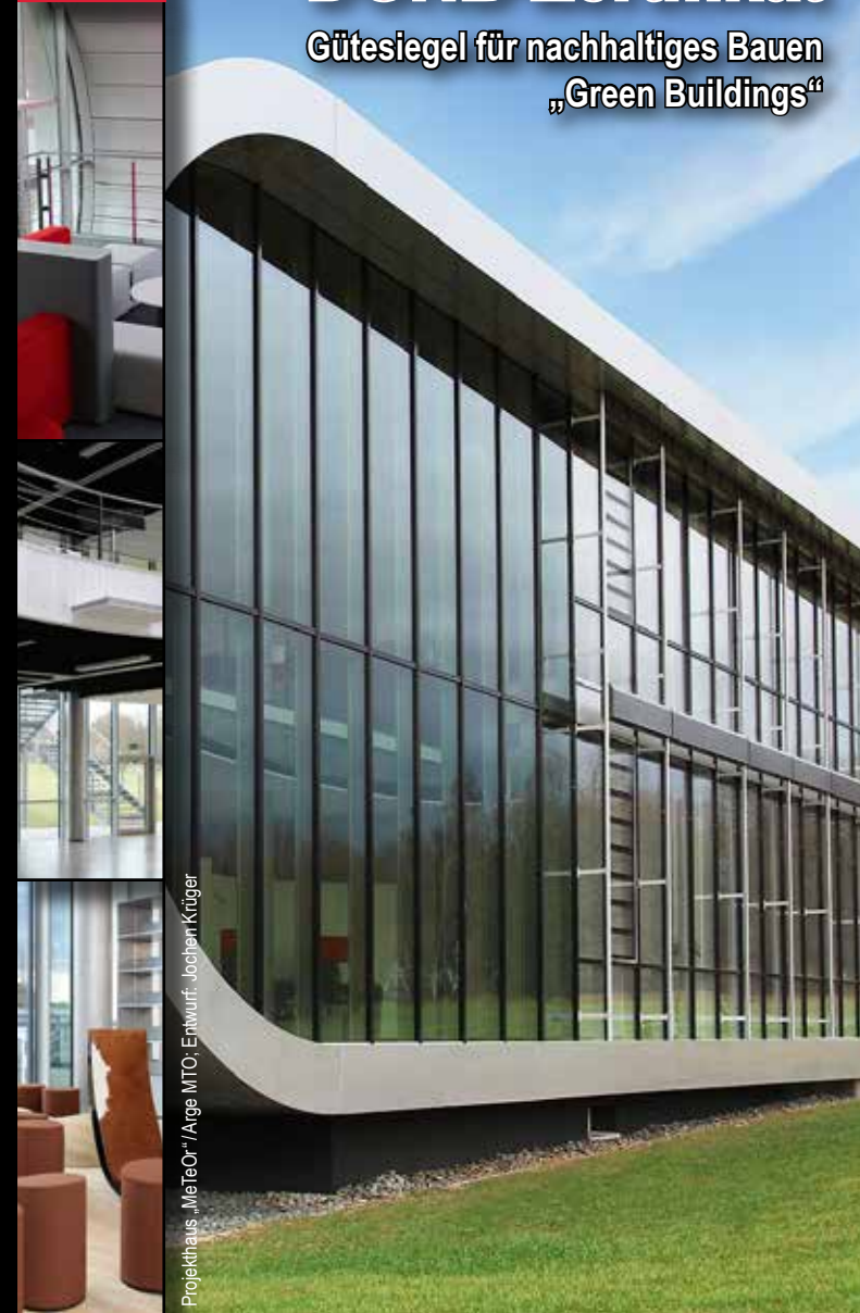
Projekthaus „MeTeOr“ / Arge MTO, Entwurf: Jochen Krüger

Gütesiegel für nachhaltiges Bauen „Green Buildings“