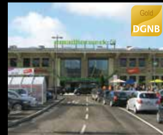
Fachmarktzentrum „Emallierwerk“, Fulda