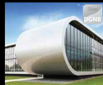
Projekthaus „MeTeOr“, TU Chemnitz