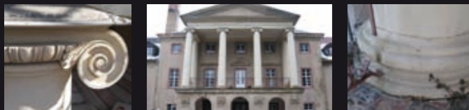
Bilder: Alten- und Pflegeheim, Schloss Löbichau